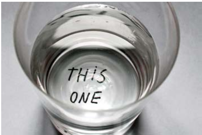
© anak&monoperro Greta. Título/Title: This One . Instalación/site specific. 2010/2011