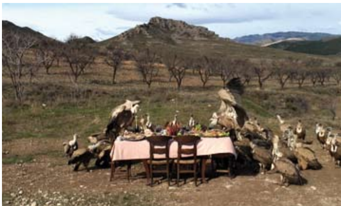
© Greta Alfaro. Título/Title: In Ictu Oculi . Video HD. 2009