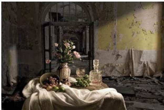
© Lynne Collins. Título/Title: The Trespasser 1 . 126x94 cm. Fotografía digital/digital photography. Enero/January 2009